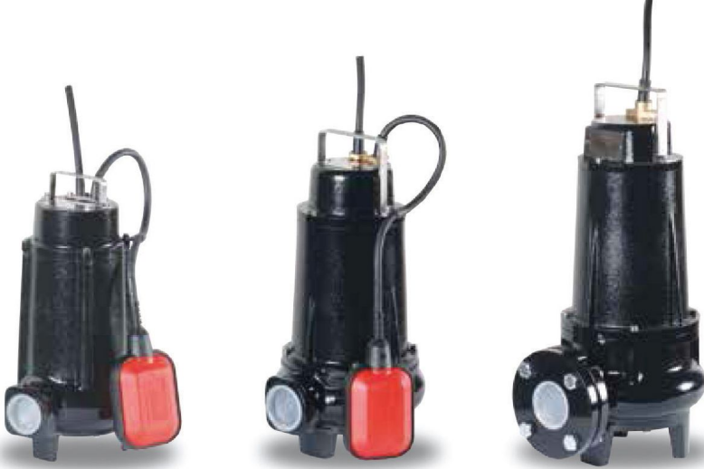
FX 50 / 32